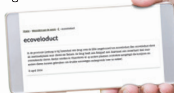
'Ecoveloduct' was woord van de week in april 2004 (via taaltelefoon.be).

Zo werd in Houthalen-Helchteren een ecotunnel onder de E314 gebouwd, die de twee natuurreservaten daar met elkaar in verbinding bracht. In Maasmechelen werd het bekende ecoduct Kikbeek aangelegd. Minder bekend is het zogenaamde ecoveloduct waar de Bilzerweg (N730) de E314 overbrugt. Deze brug is autovrijgemaakt, enkel fietsers, wandelaars en dieren kunnen er de snelweg oversteken. Via kilometerslange ecorasters worden de dieren naar de oversteekplaatsen geleid.