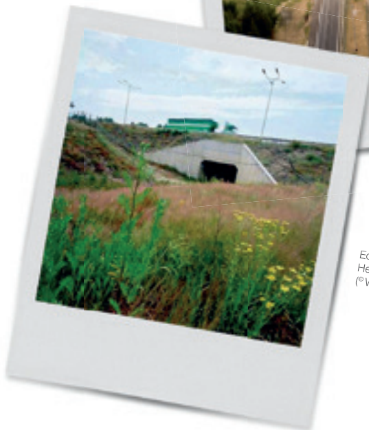
Ecotunnel in Houthalen-Helchteren/Zonhoven.