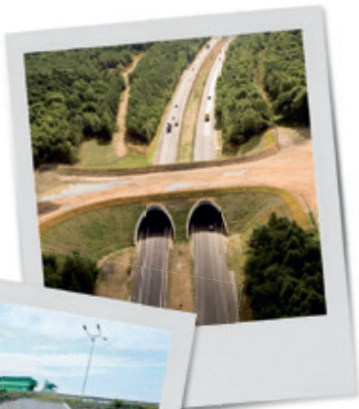
Foto van het pas aangelegde ecoduct (2006).