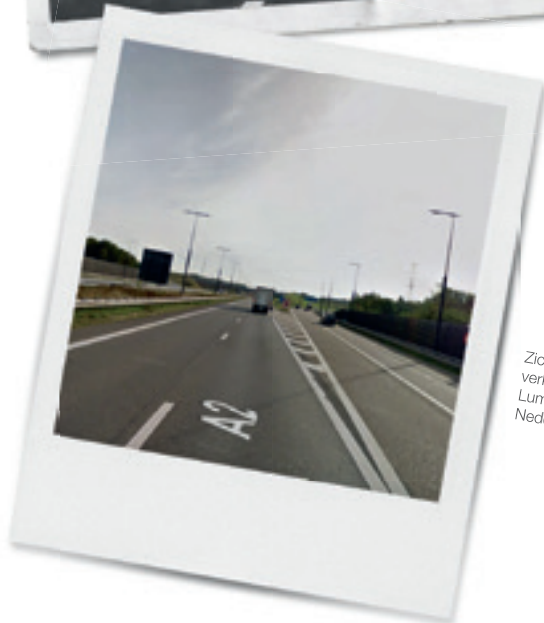
Zicht op de verkeersturbinen van Lummen, richting Nederland (2018).

De E314 loopt niet door Beringen. Over het grondgebied van de Limburgse gemeente loopt wel de E313 , het onderdeel van de Koning Boudewijnsnelweg tussen Antwerpen en Luik. Deze op één na oudste snelweg in België (na de E40 tussen Oostende en Brussel) werd in 1964 volledig opengesteld voor het verkeer.