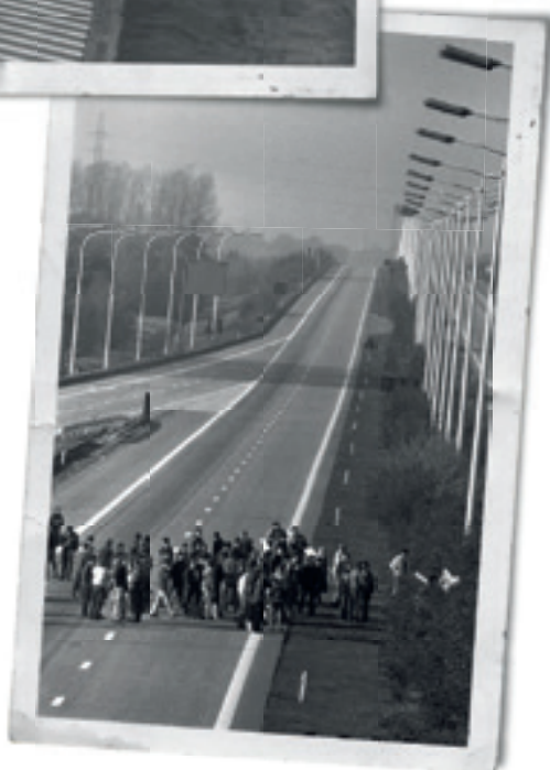
Protesteersers tegen de mijnsluitingen blokkeerden de E314 meermaals (1990).