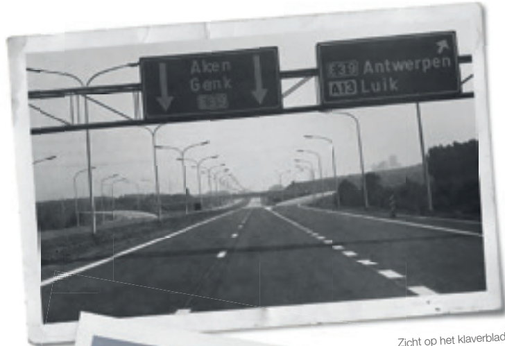
Zicht op het klaverblad van Lummen, richting Nederland (1979).