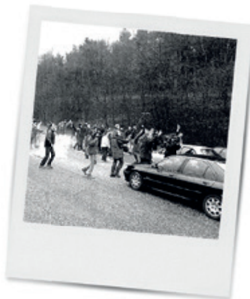
Buurt Hengelhoef blokkeert snelweg. (Het Belang van Limburg, 18 december 2000)