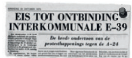
(Het Belang van Limburg, 20 oktober 1975)