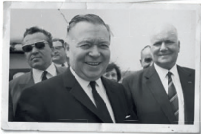
Gouverneur Roppe zette de baggerboot in werking op 11 mei 1970.