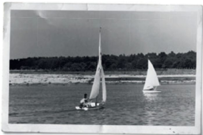
Zeilers op de 'Plas' (1975).

In 1970 werd een 360 ton zware boot in een uitgegraven put in de Houthalense heide gemonteerd. De baggerboot zou er de komende maanden zowat 1,5 miljoen kubieke meter zand opspuiten voor de aanleg van de E39.