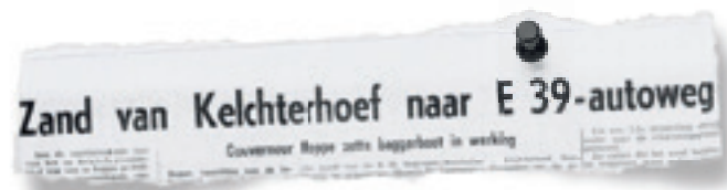
(Het Belang van Limburg, 12 mei 1970)

Het zand werd door een kilometerslang netwerk van pijpleidingen gestuwd tot aan de plaats waar het nodig was. De gemeenteraad had de opdracht gegeven om het uit te baggeren meer een bepaalde vorm te geven, namelijk die van de 'Plas' zoals ze er vandaag nog bijligt. In 1973 sloot vzw 'De vrienden van Kelchterhoef' een overeenkomst met de Intercommunale E39 voor het beheer en uitbating van de zandwinningsput. Vrijwel meteen vond zeilclub V.V.W. Kelchteren daar haar thuisbasis