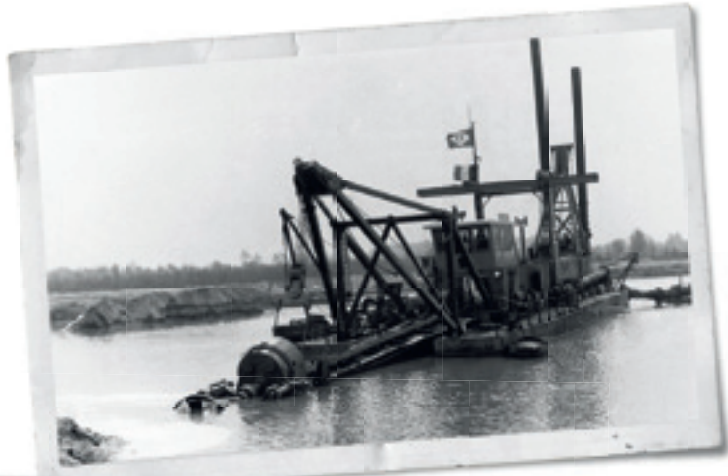
De boot die 'De Plas' in Kelchterhoef uitbaggerde (1970).