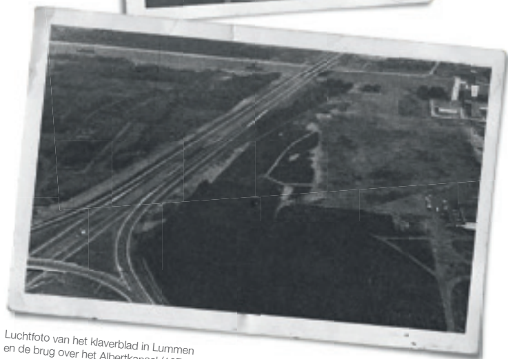
Luchtfoto van het klaverblad in Lummen en de brug over het Albertkanaal (1971).

De vakken I (Lummen tot Zolder) en II (Zolder tot Houthalen) van de E314 lopen over het grondgebied van Heusden-Zolder. In Zolder waren 419 onteigeningen gepland voor de aanleg van de snelweg. De werken aan vakken I en II hadden plaats tussen 1 april 1969 en 12 februari 1973.