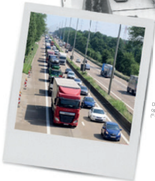
De zoveelste file op de E314 (2018).