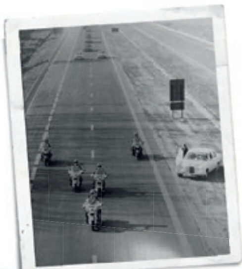
Officiële opening van het vak Lummen-Zolder (1971).