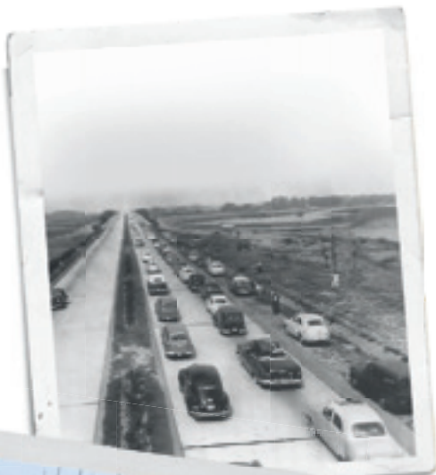
De eerste file in België: stapvoets naar Expo '58.